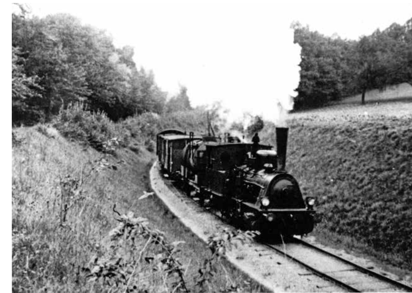
Bahnlinie hinter der Rottwaldstraße, 1950

1972 wurde auch die Teilstrecke von Odenheim nach Tiefenbach stillgelegt. Heute fährt die Stadtbahn der Albta-Verkehrsgesellschaft (AVG) von Karlsruhe über Bruchsal nach Odenheim. Der Anschluss von Tiefenbach, Eichelberg und Elsenz wird durch eine Buslinie der AVG gewährleistet.