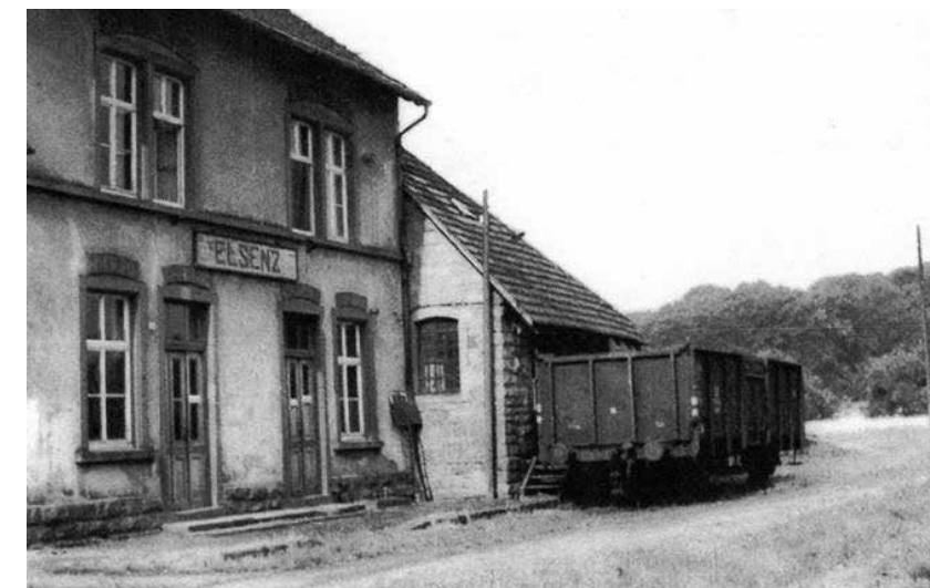
Bahnhof Elsenz, um 1960

Weitere Informationen rund um die Stadt Eppingen: